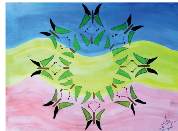
L'harmonie de la nature Cibraan, 14 ans

“ Violans dan sosiete finn bien ogmante. Mem lekol landrwa kot sipoze pe donn zanfàn savwar viv pa pe sape. Degree violans, dan ninport ki form finn vinn enn size ki merit enn refleksion serye depi sakenn de nou.